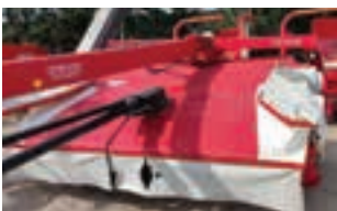
ANTONIO CARRARO TIGRONE 3700

Χορτοδεκτική πρέσα WELGER 630, τετράγωνου δέματος με σχοινί. Γ. ΧΙΓΚΑΣ Α.Ε.Β.Ε. Τηλ: 2310780866-9