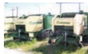
KRONE COMPI PACK

Εναιροδιανομέας FARESin 9 κυβικών, ΚΥΡΙΑΚΟΥ Α.Ε. Τηλ. 2310753031