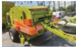
WOLAGRI COLUMBIA R10

Πλήρως ανακατασκευασμένες πνευματικές σπαρτικές μηχανές GASPARDO 540 με καρίνα, 4 σειρών με διανομείς φαρμάκου και με δυνατότητα προσθήκης λιπάσματος. Γ. ΧΙΓΚΑΣ Α.Ε.Β.Ε. Τηλ: 2310780866-9