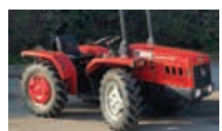
ANTONIO CARRARO TIGRONE 3700

Βυτίο λυμάτων μάρκας VENDRAME τύπου 14 m3 με πύραυλο, σε άριστη κατάσταση. ΑΦΟΙ Χ. ΓΙΑΝΝΑΚΟΥΛΑ Ο.Ε Τηλ. 2310 796807