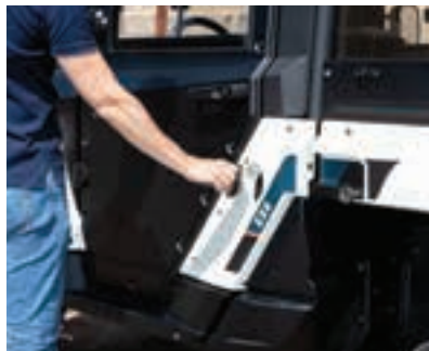
Διαθέτει σιδερένιο προστατευτικό κάλυμμα του χώρου φόρτωσης.

Με το πάτημα ενός κουμπιού η κίνηση γίνεται 4x2 ή 4x4 και με την επιλογή κλειδώματος του διαφορετικού ανταπεξέρχεται σε δύσκολες συνθήκες και σε όλα τα εδάφη.