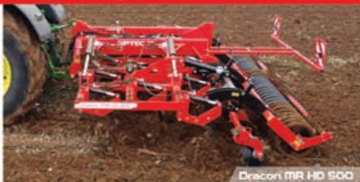
Dragon MR HD 500 πλάτος HD 300