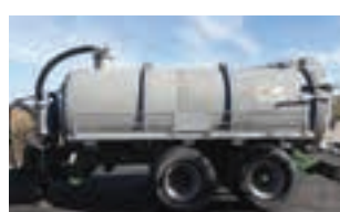
ΒΥΤΙΟ ΛΥΜΑΤΩΝ VENDRAME