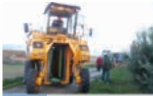
GREGOIRA G 122 SW