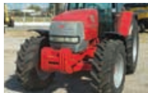
MTX MCCORMICK MTX 150

Valpadana 4RM 300, 30 HP, Μοντέλο 1997 και 1600 ώρες. ΠΑΝΑΓΙΩΤΗΣ ΚΑΤΣΑΡΟΣ Α.Ε.Τ.Β.Ε. 2310723793.