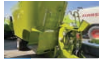
STORTI DUNKER T2.180