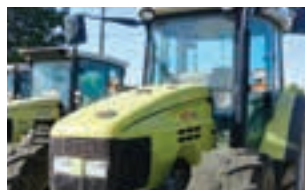
HURLIMANN XT 105

HURLIMANN H-435 DT (35hp) Μοντέλο 2001 Α & Φ ΙΩΑΝΝΙΔΗΣ Α.Ε. Τηλ. 2461021000-2.