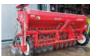
NEW HOLLAND T4.80F

Συρόμενο χορτοκοπτικό LELY 370, μοντέλο 2012, με σιδερένιο συνθλιπτικό. Γ. ΧΙΓΚΑΣ Α.Ε.Β.Ε. Τηλ: 2310780866-9