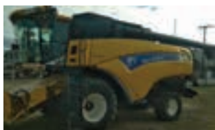
NEW HOLLAND CX 880

MTX Θεριζοαλωνιστική NEW HOLLAND CX 880 , 401 hp, 3.657 ώρες, μοντέλο 2005 και στοιχεία επικοινωνίας ΠΑΥΛΟΣ Ι. ΚΟΝΤΕΛΛΗΣ Α.Ε.Β.Ε. 2310779072