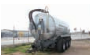
ΒΥΤΙΟ ΛΥΜΑΤΩΝ VAIA

Χορτοδετική πρέσα Krone Vario 1500 μεταβλητού θαλάμου και Συρόμενο χορτοκοπτικό Krone 3210 CRI. Κυριακού Α.Ε. Τηλ. 2310753031.