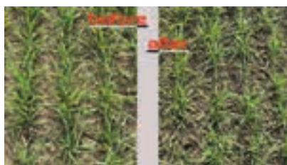
Το πριν και το μετά από το πέρασμα.

Ο ικονομικό έλεγχο μικρών ζιζανίων σε συνδυασμό με αναδιόπηση συμπίεσμένου ή σκληρού εδάφους, και, όλα αυτά, σε υψηλές ταχύτητες της τάξεως των 12-25 κλμ/ώρα, υπόσχεται ο αεριστής εδάφους Sonic 600 που κατασκευάζει η Siptec. Πρόκειται για ένα μηχάνημα το οποίο εμπιστεύτηκε ύστερα από επίδειξη, ο βραβευμένος Αγρότης της Χρονιάς 2023, Μιλτιάδης Χαρένης ο οποίος όπως δήλωσε στο profi εντυπωσιάστηκε από την επίδειξη που πραγματοποίησε η εταιρεία στην εκμετάλλευσή του: «Το μηχάνημα καλλιεργεί 1-2 πόντους, σπάει την κρούστα, αερίζει τη ρίζα για να αναπνεύσει το φυτό και πραγματοποιεί μερική ζιζανιοκτονία, χαλώντας τα μικρά ζιζάνια». Επίσης, το μηχάνημα αυτό είναι ιδανικό για χρήση σε μία δύσκολη χρονιά που θα γίνει η σπορά με ξέρα καθώς σπάει την κρούστα λόγω των ισχυρών