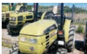
HURLIMANN H-435 DT

HURLIMANN H 709 XN: 90HP, Μοντέλο 2004 Α&Φ ΙΩΑΝΝΙΔΗΣ Α.Ε. Τηλ. 24610-21000