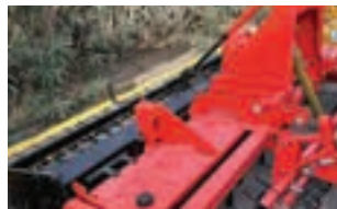
MASCHIO DRAGO '98

John Deere 4755, μοντέλο 1991, 6κύλινδρο στα 190 άλογα σε πολύ καλή κατάσταση έτοιμη για δουλειά! Γ. ΧΙΓΚΑΣ Α.Ε.Β.Ε. Τηλ: 2310780866-9