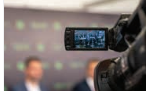
Το ζήτημα είναι οι επενδύσεις στην αγροτική τεχνολογία να «βγάλουν τα λεφτά τους».