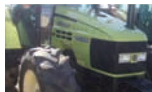
HURLIMANN XT 908

Εναιροδιανομείς Luclar Ιταλίας οριζόντιοι με 2 καλίες από 5-12 κθβ. Κυριακού Α.Ε. Τηλ. 2310753031.