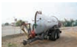
ΒΥΤΙΟ ΛΥΜΑΤΩΝ AMOS

Τηλεσκοπικοί φορτωτές Dieci, Merlo 100 ίππων με μέγιστη ανύψωση 7μ. Κυριακού Α.Ε. Τηλ. 2310753031.