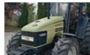
HURLIMANN PRESTIGE 75

HURLIMANN XB 95 TB (96hp) Μοντέλο 2011 Α & Φ ΙΩΑΝΝΙΔΗΣ Α.Ε. Τηλ. 2461021000-2.