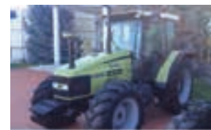
HURLIMANN XT 910.6

HURLIMANN XT 105, 100 HP, Μοντέλο 2006, Α&Φ ΙΩΑΝΝΙΔΗΣ Α.Ε. Τηλ.: 2461021000