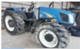
NEW HOLLAND - T5050

Χορτοδετική πρέσα τετράγωνου δέματος New Holland 570, Δετικό με σύρμα- 2004. ΑΔΕΛΦΟΙ ΣΑΡΑΚΑΚΗ Α.Ε.Β.Μ.Ε. 2103483300.