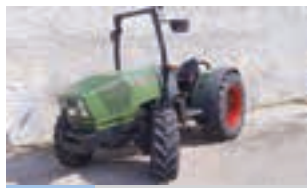
HURLIMANN XF 80 SPIRIT

Τρακτέρ New Holland T50-50 Χωρίς Καμπίνα - 2012, κινητήρας 4500cc με 4 κυλίνδρους, 95 HP. ΑΔΕΛΦΟΙ ΣΑΡΑΚΑΚΗ Α.Ε.Β.Μ.Ε. 2103483300.