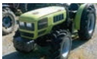
HURLIMANN H 709 XN

Τρακτέρ HURLIMANN PRESTIGE 75 ΜΟΝΤΕΛΟ 2010, 75HP, Α&Φ ΙΩΑΝΝΙΔΗΣ Α.Ε. Τηλ. 2461021000