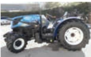
NEW HOLLAND T4.80F

Antonio Carraro TIGRONE 3700, 4WD, 32 HP, Μοντέλο 1993 και 2000 ώρες, με αμίδα προστασίας. ΠΑΝΑΓΙΩΤΗΣ ΚΑΤΣΑΡΟΣ Α.Ε.Τ.Β.Ε. 2310723793