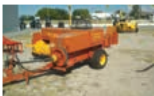
ΧΟΡΤΟΔΕΤΙΚΗ ΠΡΕΣΑ 575

MTX LANDINI POWERFARM 105, 99 hp, 4WD CAB, 6.180 ώρες, μοντέλο 2009 και στοιχεία επικοινωνίας ΠΑΥΛΟΣ Ι. ΚΟΝΤΕΛΛΗΣ Α.Ε.Β.Ε. 2103408817