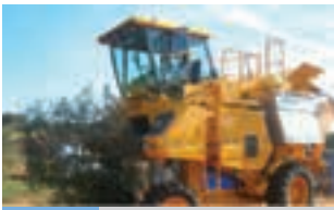
GREGOIRE G 140 SW

Το Profi, πιστό στη δέσμευσή του για προσφορά μιας ολοκληρωμένης εικόνας της αγοράς αγροτικών μηχανημάτων, ανανεώνει κάθε μήνα την ειδική στήλη για τα μεταχειρισμένα μηχανήματα, όπου ιδιώτες και εταιρείες διευκολύνουν τον υποψήφιο αγοραστή μεταχειρισμένου στην αναζήτηση του κατάλληλου εξοπλισμού