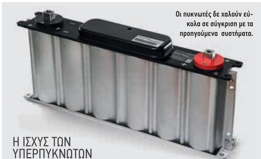
Οι πυκνωτές δε χαλούν εύκολα σε σύγκριση με τα προηγούμενα συστήματα.

Πολλά μπορούν να συμβούν μέσα σε τέσσερα χρόνια. Το εντυπωσιακό μηχανήμα με φουτουριστικό στυλ που εμφανίστηκε στην Agritechnica 2019 μεταμορφώθηκε σε ένα βραβευμένο πρωτότυπο με υβριδικό σύστημα μετάδοσης κίνησης που υποβάλλεται σε δοκιμές στο χωράφι. Το Steyr Hybrid CVT μπορεί να αποδώσει έως 191 kW χάρη σε ένα ηλεκτρικό μοτέρ που μπορεί να μεταδίδει έως 75 kW μέσω του μπροστινού άξονα προς το σύστημα μετάδοσης. Ενδιαφέρον να δούμε αν η CNH θα προωθήσει το κόνσεπτ.