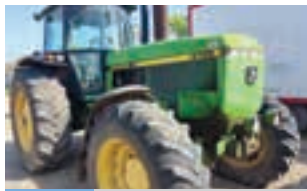
John Deere 4755

Πλήρως ανακατασκευασμένες πνευματικές σπαρτικές μηχανές GASPARDO MT600 με δίσκο, 4 σειρών με διανομείς φαρμάκου και λιπάσματος σε υπερ-άριστη κατάσταση. Γ. ΧΙΓΚΑΣ Α.Ε.Β.Ε. Τηλ: 2310780866-9