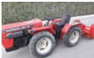
VALPADANA 4RM 300

New Holland T4.80F, 4WD, 75 HP, Μοντέλο 2021 και μόνο με 197 ώρες. ΠΑΝΑΓΙΩΤΗΣ ΚΑΤΣΑΡΟΣ Α.Ε.Τ.Β.Ε. 2310723793.