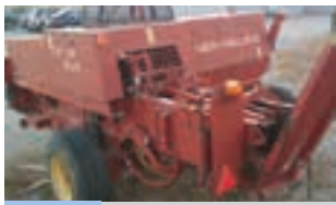
ΠΡΕΣΑ New Holland 570

Χορτοδετική πρέσα τετράγωνου δέματος New Holland 570, Δετικό με σύρμα- 2004. ΑΔΕΛΦΟΙ ΣΑΡΑΚΑΚΗ Α.Ε.Β.Μ.Ε. 2103483300.