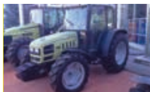
HURLIMANN XA 76

HURLIMANN XT 908, 85 HP, Μοντέλο 2000, Α & Φ ΙΩΑΝΝΙΔΗΣ Α.Ε. Τηλ. 2461021000