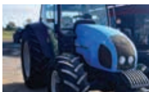
MTX LANDINI POWER

MTX Θεριζοαλωνιστική NEW HOLLAND CX 880 , 401 hp, 3.657 ώρες, μοντέλο 2005 και στοιχεία επικοινωνίας ΠΑΥΛΟΣ Ι. ΚΟΝΤΕΛΛΗΣ Α.Ε.Β.Ε. 2310779072