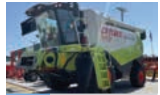
CLAAS LEXION 520

Άροτρο 3υπο αναστρεφόμενο, έτος 1996, 4000 ευρώ. Γ.Ι. Αντωνάκης Α.Ε., Τηλ. 2262025915.